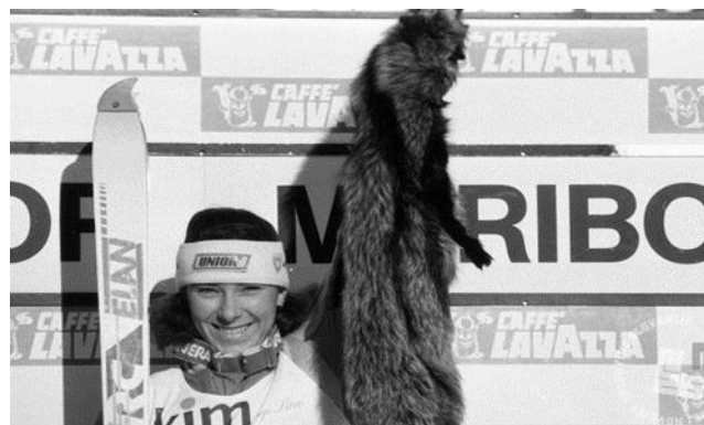
Slika 12: Nagrada ob zmagi, lisičji kožuh