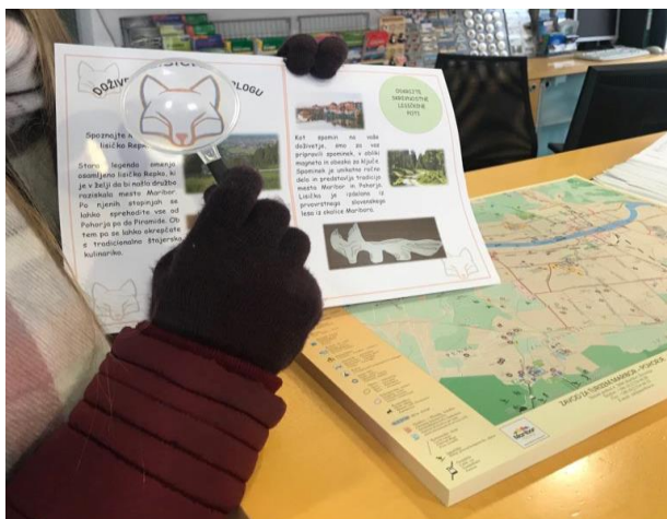
Slika 4: Snemanje v Turistično-Informacijskem centru