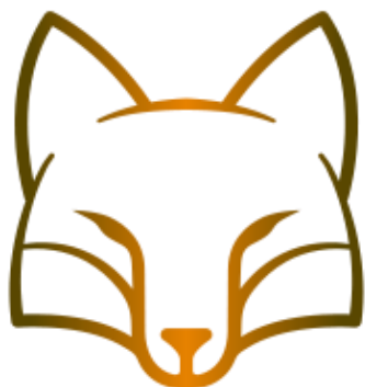
Slika 3: Logotip

Logotip smo ustvarili sami s pomočjo spletne strani (freelogodesign). Predstavlja glavo lisice, ki je tudi osrednja tema naše naloge. Sam logotip je oranžno-zlate barve. Ti barvi upodabljata naravno barvo lisice in barvo lisice smučarskega tekmovanja. Simbol je povezan z našo temo.