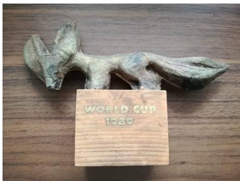
Slika 13: Spominek Zlate lisice