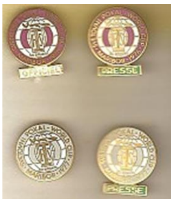
Slika 9: Broške tekmovanja za Zlato lisico