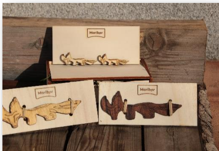
Slika 1: Slika izdelka

Spominek je narejen iz lesa vrste topol in oreh. Osnovne mere magneta so: