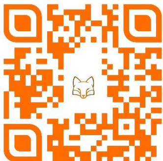
Slika 14: QR koda z zgodbico