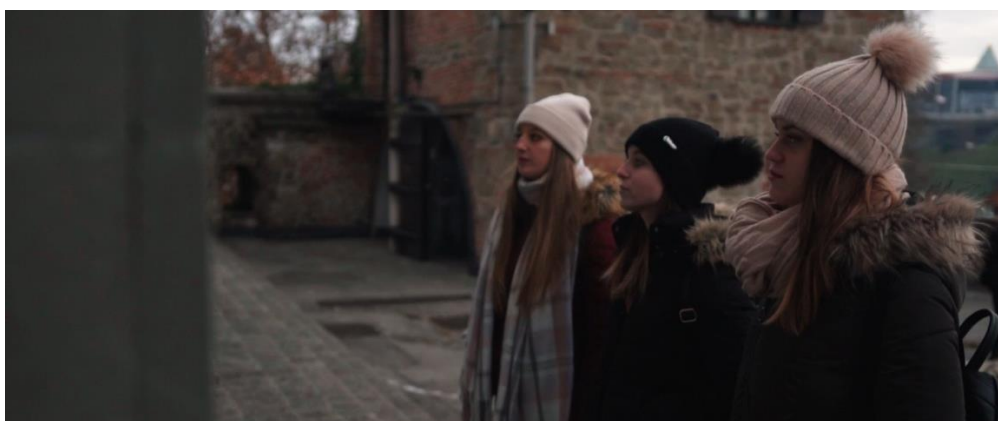
Slika 5: Židovski trg