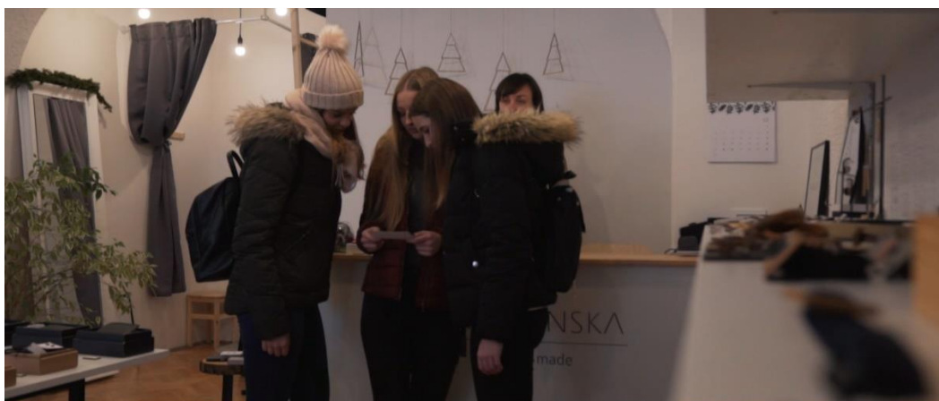
Slika 6: Trgovina Moi Style