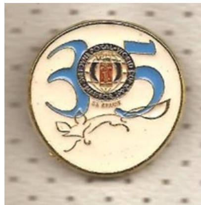
Slika 10: Broška tekmovanja za Zlato lisico