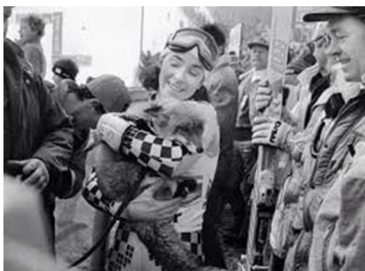
Slika 11: Nagrada ob zmagi