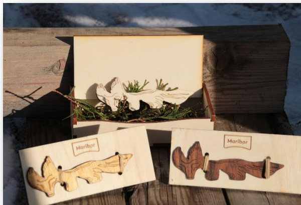
Slika 2: Slika embalaže

Za embalažo smo si zamislili dve obliki, škatlico in ploščico, obe pa sta narejeni iz lesa, vrste topol. Škatlica, v kateri bo spominek, je napolnjena z vejicami smreke. Na pokrovu je žgan logotip Maribora, na notranji strani pokrova pa je napis »lisička«. Druga embalaža, ploščica, ima na sprednji strani logotip Maribora. Ima štiri luknjice, skozi katere bo z vezicami privezana lisička. Tako kot spominek, je tudi embalaža trajnostna.