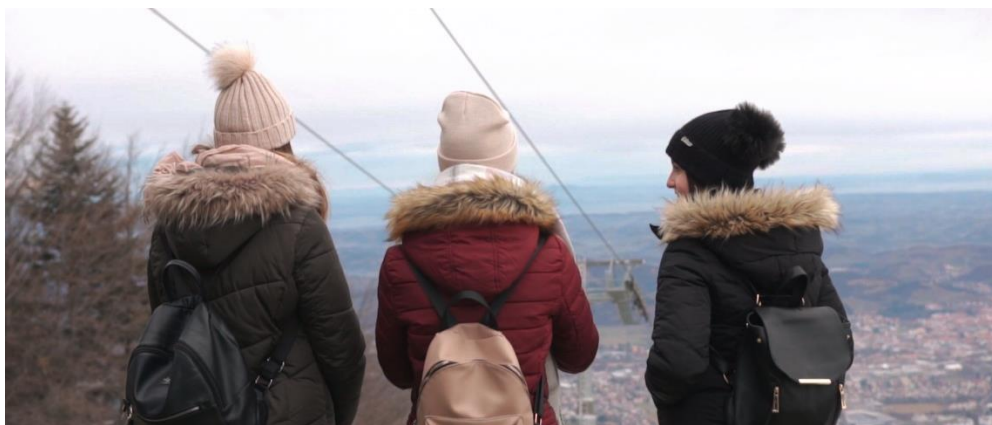
Slika 7: Pohorje