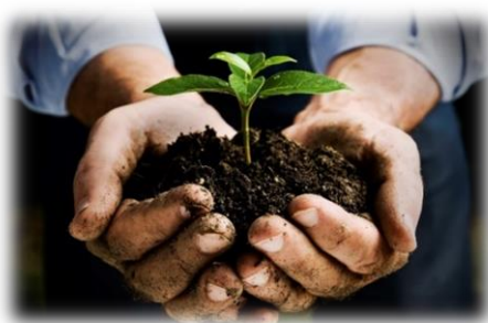
Slika 1: Biodinamika

Biodinamika ni le sonaravni način pridelovanja, temveč je tudi način življenja, po besedah biodinamikov po svetu celo življenjska filozofija. Nanaša se na delo z energijami, ki ustvarjajo in vzdržujejo življenje. Beseda izvira iz dveh besed grškega izvora; bio ( gr. bios ), kar pomeni življenje ter dinamika ( gr. dynamis ), kar pa pomeni moč, energija. Prav iz tega razloga v biodinamiki kmetija ne predstavlja le objekta, ampak celoten organizem, katerega organi so njive, travniki, sadovnjaki, rastline, živali in navsezadnje tudi ljudje, ki skupaj predstavljajo celoto, na katero učinkuje vesolje, torej kozmos, s silami planetov našega osončja in ozvezdij zodiaka, ki nam jih posreduje Luna. Z delom ob ugodnih dneh glede na del rastline se omogoča še boljši razvoj rastline, hkrati pa se zmanjša potreba po zaščitnih sredstvih.