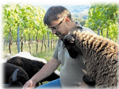
Slika 2: Biodinamik Zorjan z ovčami

Skrbno pridelano grozdje zmeraj macerirajo, da se življenje v njem nadaljuje. Polovico pridelka grozdja dajo v dolije 1 , kateri so zakopani v zemljo pod milim nebom. Grozdje sile kozmosa preko zime predelajo v vino in tako dobimo edinstveno živo vino, kjer je človek le v vlogi opazovalca. Druga polovica vina pa se hrani v hrastovih sodih z minimalno uporabo žvepla. Vina so tako polna, trdna in žlahtno odražajo svojo kvasovko.