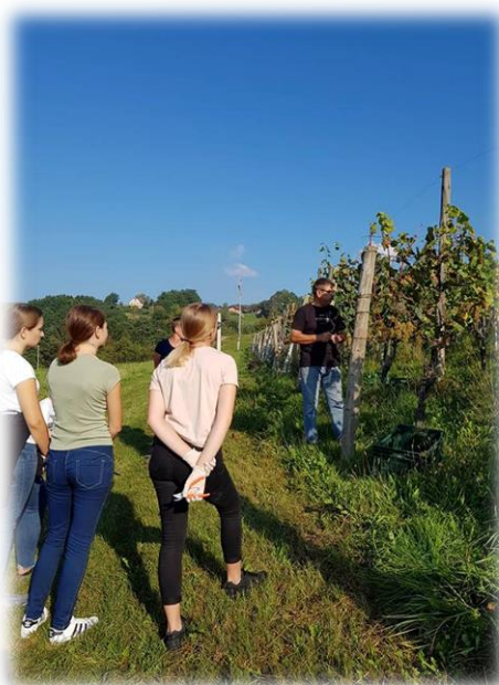
Slika 7: Gospoda Zorjana smo skrbno poslušali