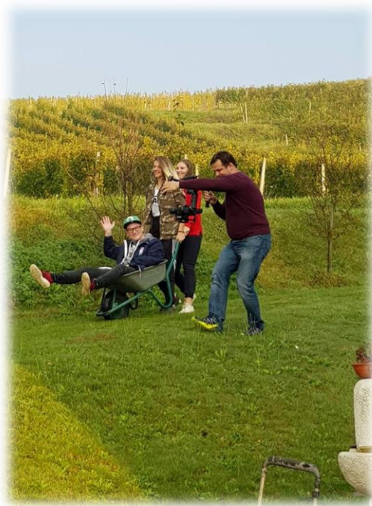
Slika 6: Tudi zabave ni manjkalo