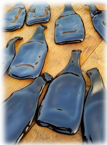
Slika 3: Pretopljene steklenice

Življenje med ritoznojskimi vinogradi, a brez vinograda, jih je povežalo z vinarstvom na svojevrsten način. Med stoletnimi zidovi mogočne baročne zidanice z imenom ŠTOK, nekoč vinogradniškim posestvom, živi namreč družina Wenzel. Iz starih, zavrženih vinskih sodov, barik sodov ter steklenic se rojevajo oblikovalski izdelki blagovne znamke ŠtokWenzel. Doga in drugi deli odsluženih sodov, ki so jim desetletja vinskih poljubov podarila edinstveno barvo in teksturo, ponovno zaživijo kot svetila, pohištvo, uporabni predmeti ali modni dodatki.