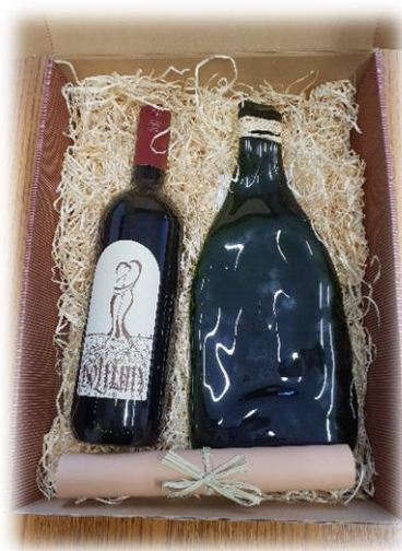
Slika 4: Turistični spominek

Tisto, kar predstavlja dodano vrednost našemu izdelku, je zagotovo približevanje zmeraj bolj odmevne biodinamike ljudem, hkrati pa skrb za okolje skozi reciklažo in ponovno uporabo po navadi zavrženih izdelkov. Zakaj bi morali steklenico, ki jo je včasih polnilo vino, polno življenja, zavreči, če lahko na ta način prispevamo k zmanjševanju odpadkov in dokazujemo, da prazna vinska steklenica ni odpadek, ki obremenjuje naravo, temveč bogastvo in estetski dosežek, ki nudi številne možnosti za ponovno uporabo. Glede na celotno zgodbo smo naš turistični spominek označili kot butični izdelek, namenjen vsem ljubiteljem lepega in dobrega, predvsem pa tistim, ki bodo zgodbo razumeli, se z njo poistovetili in jo znali ceniti.