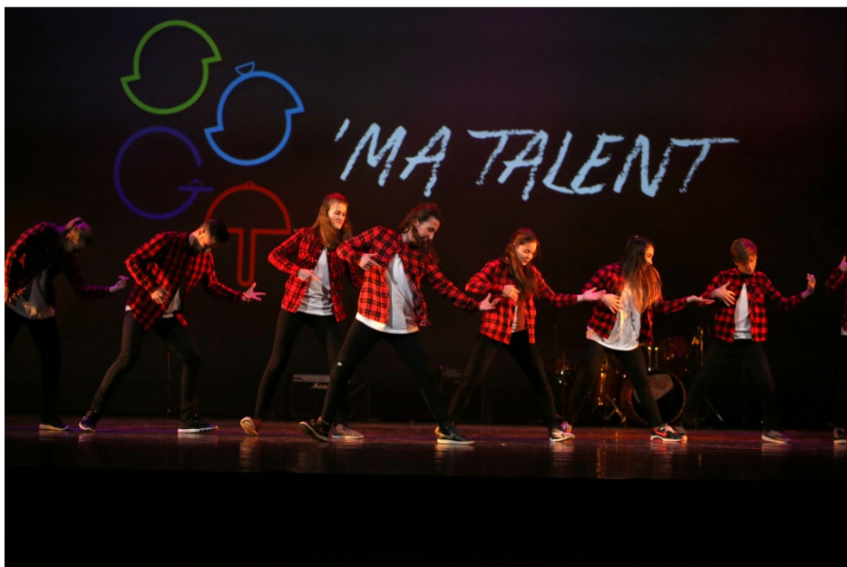
Hip –hop ples