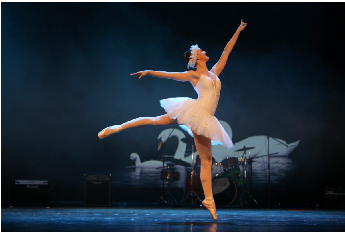
Lana Žabčič, svetovna in evropska prvakinja v twirlingu