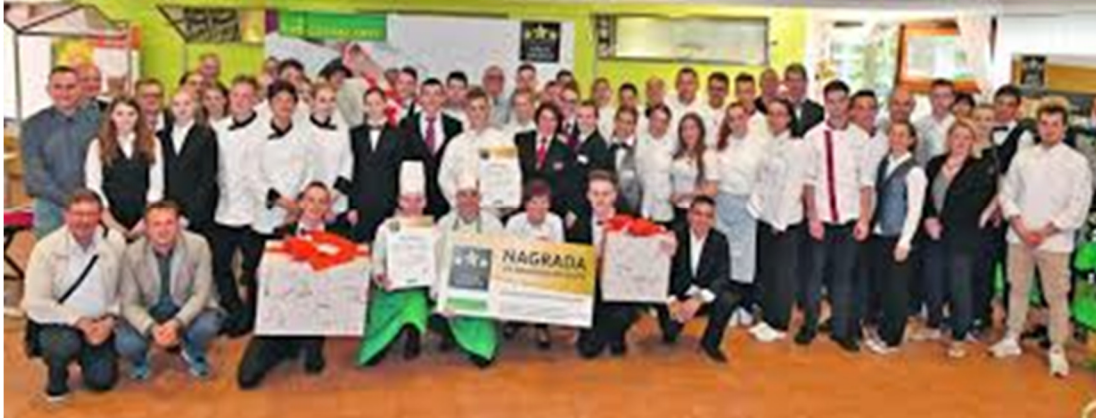
Finale TUŠEVA ZVEZDICA 2018, Debeli rtič, 14. 5. 2018

www.ssgt-mb.si e-pošta: ss.gtmb@guest.arnes.si