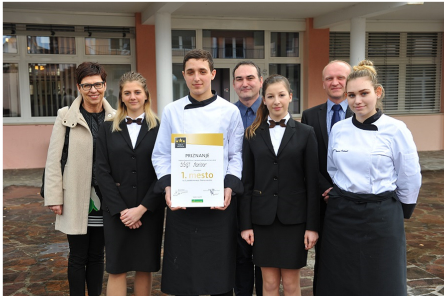
3. predtekmovanje TUŠEVA ZVEZDICA 2018, Radovljica, SŠGT Radovljica, 15. 3. 2018