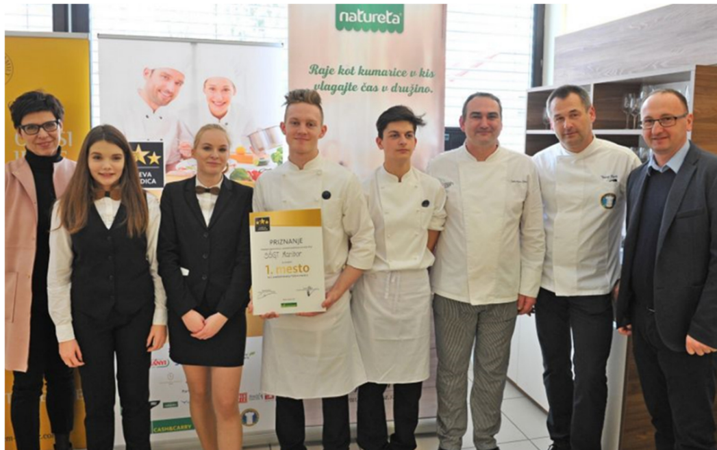
2. predtekmovanje TUŠEVA ZVEZDICA 2018, Maribor, SŠGT Maribor, 13. 2. 2018